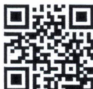
Qr Code ลงทะเบียนเข้าร่วมการประชุมวิชาการฯ